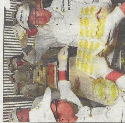
Die Miniköche haben sich den Weltrekord im Knödeldrehen geholt. Innerhalb von drei Stunden wurden 6886 Knödel geformt.