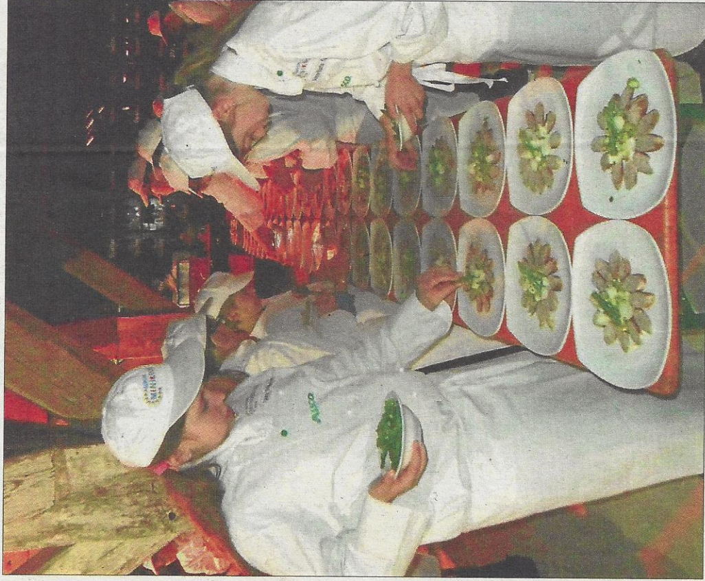
Perfekt wurde die Vorspeise angerichtet für den Abschluss-Galaabend im alten Kornspeicher in Spalt bei Nürnberg.