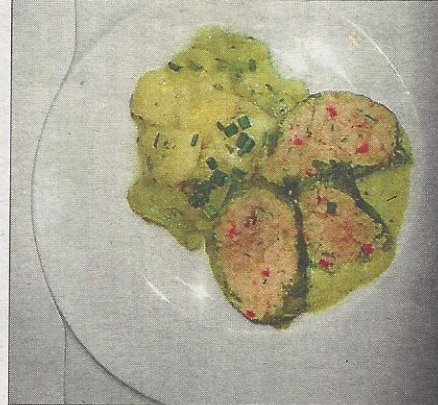
Wickel vom Hecht aus der frei fließenden Donau mit Kräutersoße.